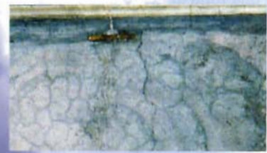
La "grappa" sopra le nuvole